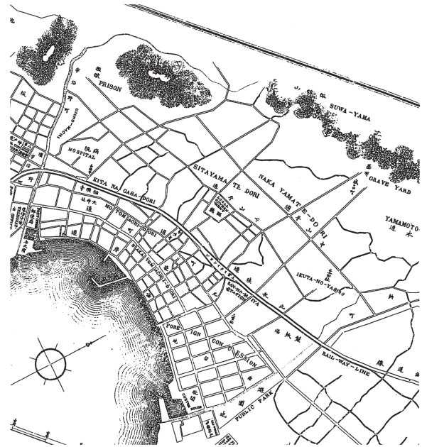
地図1 6) 明治10年の神戸市街(居留地と雑居地)

本稿では、行政区域上の呼称としては「神戸市」、「兵庫県」と使用し、地域に言及する場合は「神戸」、「兵庫」の名称を使用する。