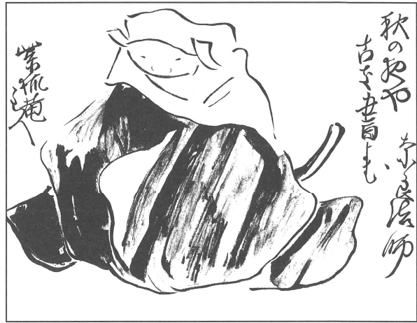
① 「秋の夜や」 自画賛 (33)

蕪村は、「秋の夜や古き書よむ奈良法師」の賛句を画面右端に記し、裏頭を被った墨染の法衣姿で左腰に太刀を差し、古書に読み耽る奈良法師の絵を画面中央に大きく描き添えた。句は、画面左端の